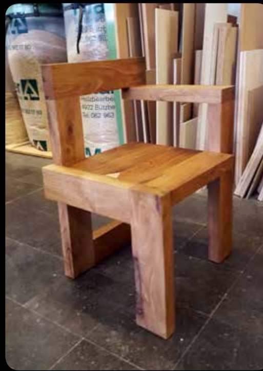
Stuhl v. Reto

Freizeitanlage Wädenswil Tobelrainstrasse 25 8820 Wädenswil 044 780 71 31 www.freizeitanlage-waedi.ch