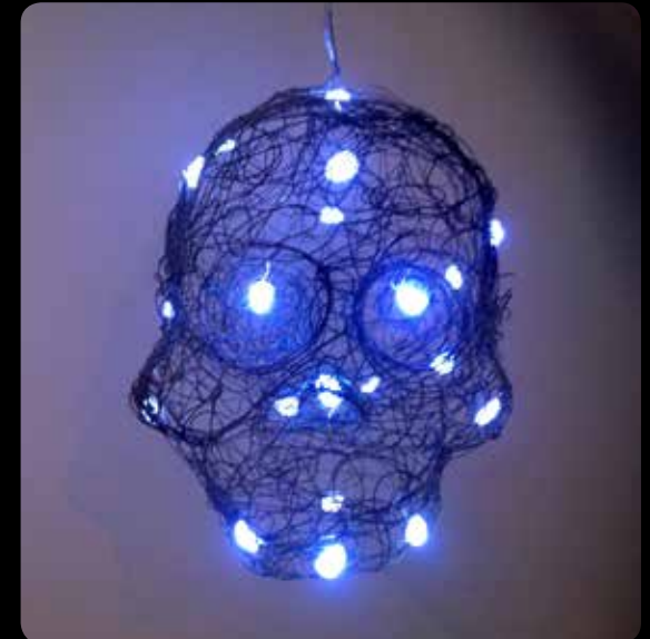
Schädellicht v. Fränzi