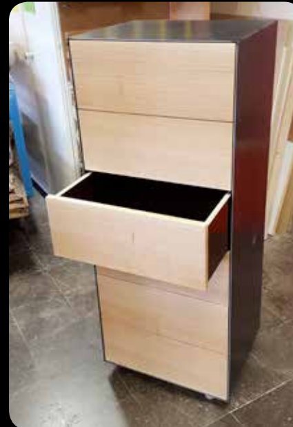
Kommode v. Marco