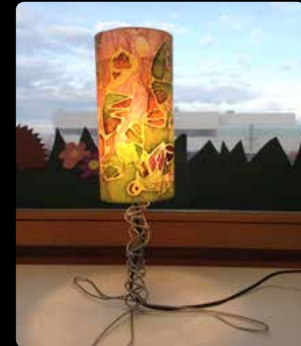
Wachsmal-Batik-Lampe v. Nelli