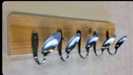
Löffelgarderobe v. Fränzi

Wir freuen uns auf eine zahlreiche Teilnahme und eine vielseitige Ausstellung!