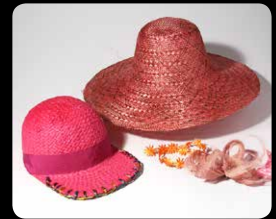
Sommerhüte v. Esther